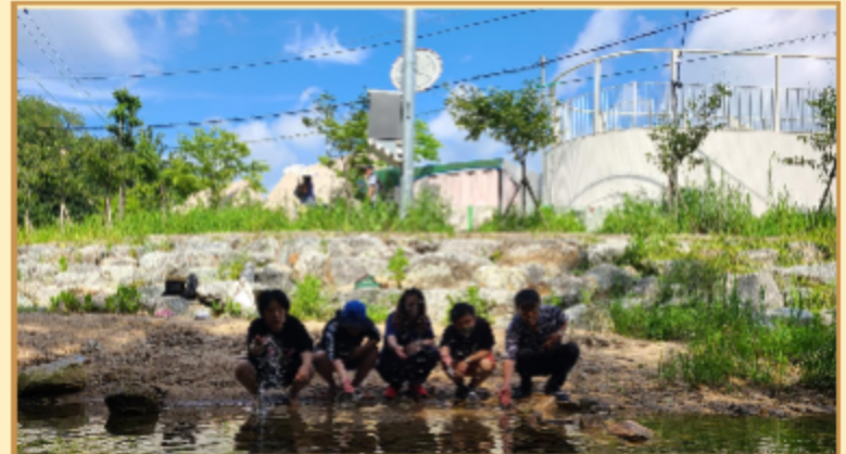
공감파트너 활동 사진: 서울역사박물관/롯데타워/무수궁