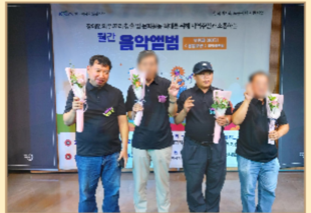
<홍열포맨> 합창공연 당일 모습