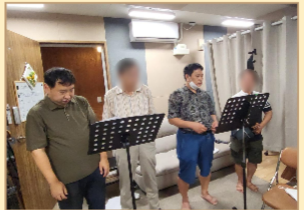
<홍열포맨> 합창공연 연습 모습