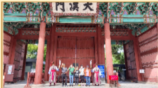
공감파트너 활동 사진: 경복궁/역수궁