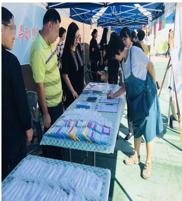
도봉구 사회복지 박람회