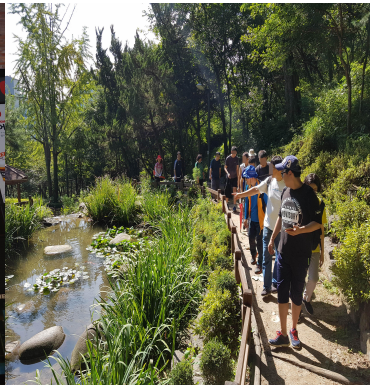
서울 둘레길 걷기