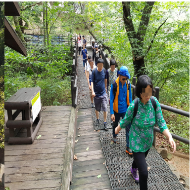
서울 둘레길 걷기