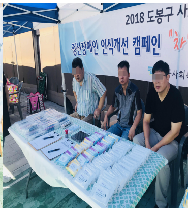
도봉구 사회복지 박람회