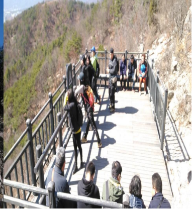
서울둘레길 걷기 3