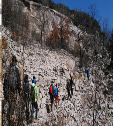
서울둘레길 걷기 2